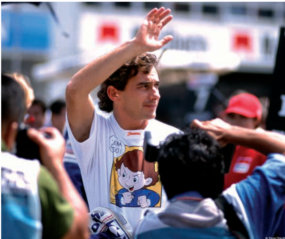
© Paola Ghirotti Grafica Roberto Steve Gobesso